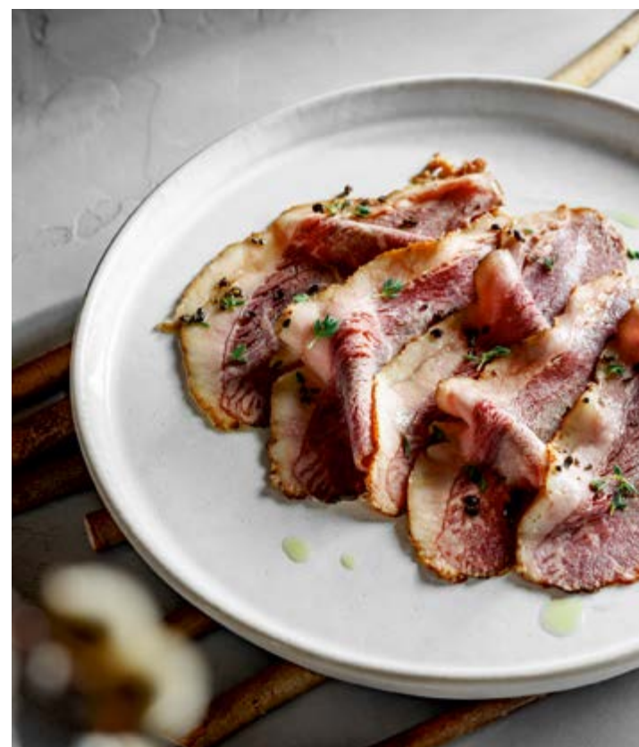
Ветчина из говядины с трюфельным маслом Beef ham with truffle oil 80г 590.-