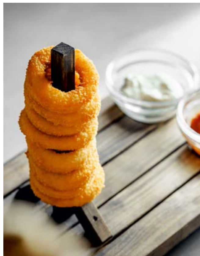
Луковые кольца с кремом из горгонзолы Onion rings with Gorgonzola cheese cream 70\50г 290.-