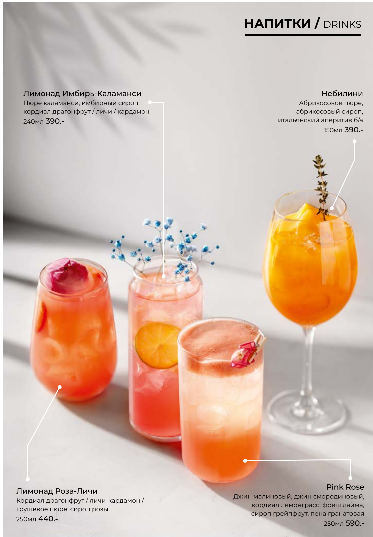
Лимонад Роза-Личи Кордиал драгонфрут / личи-кардамон / грушевое пюре, сироп розы 250мл 440.-