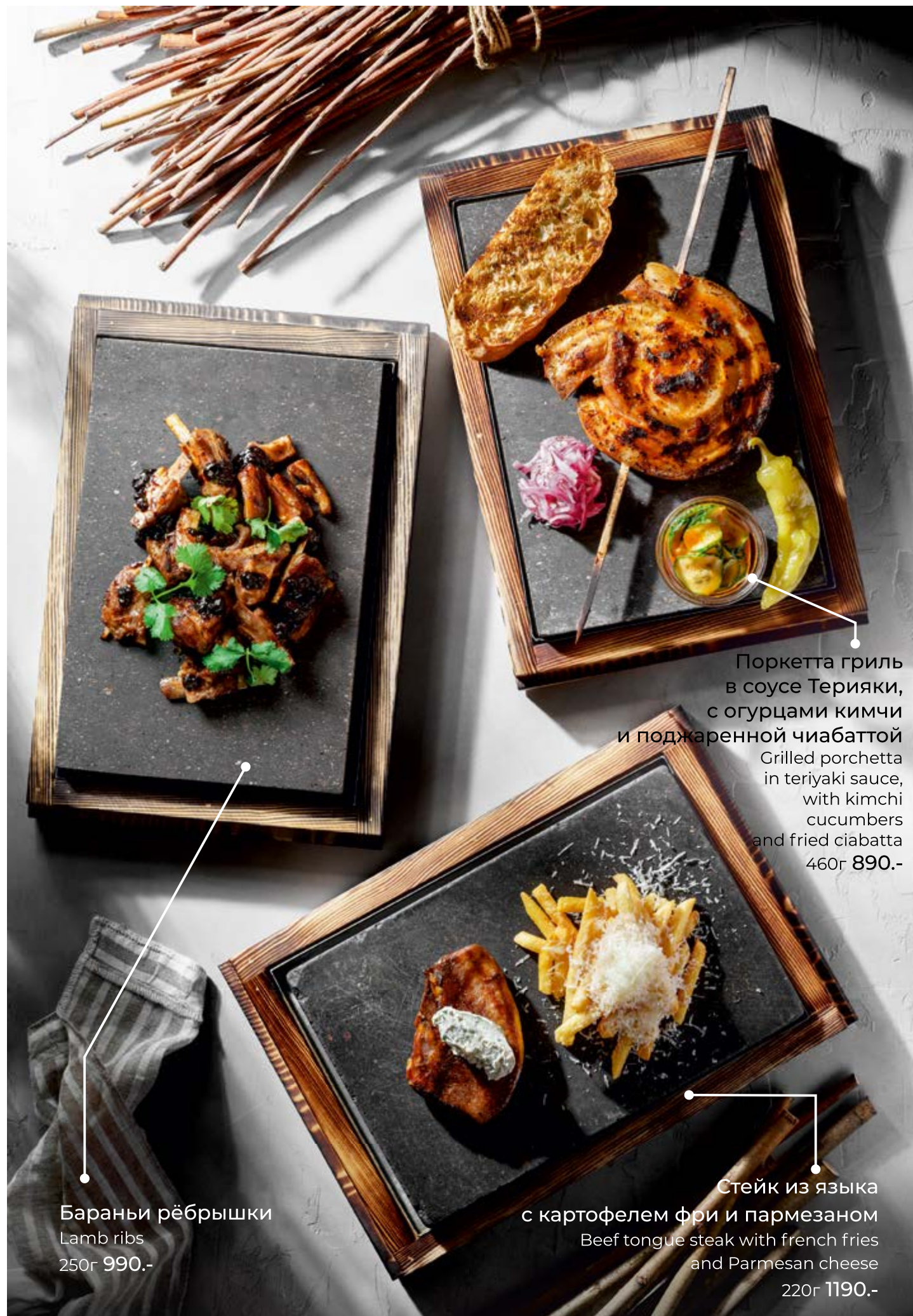
Бараньи рёбрышки Lamb ribs 250г 990.-