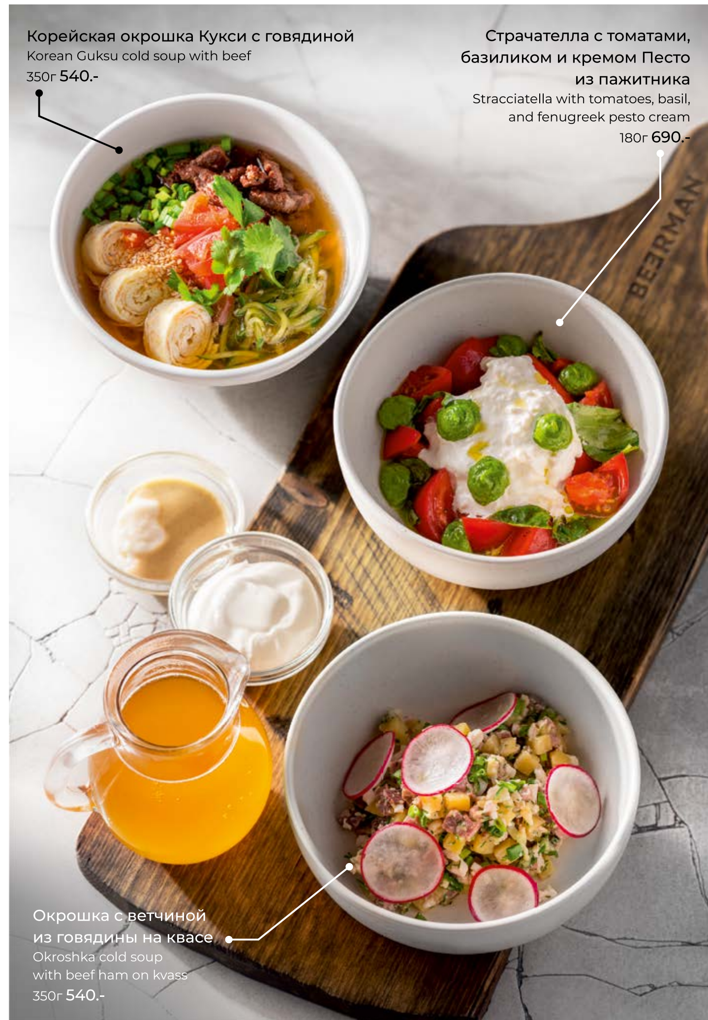
Корейская окрошка Кукси с говядиной Korean Guksu cold soup with beef 350г 540.-