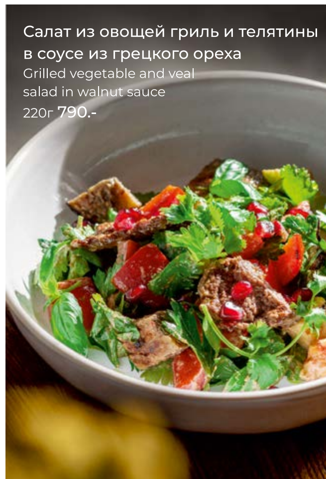
Салат из овощей гриль и телятины в соусе из грецкого ореха Grilled vegetable and veal salad in walnut sauce 220г 790.-