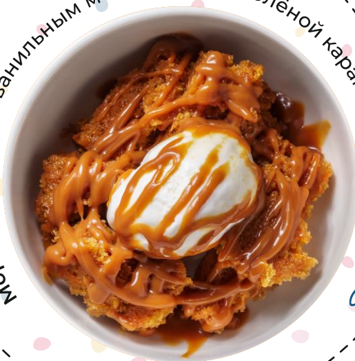
Морковный кейк с ванильным мороженым и солёной карамелью 80г 140.-