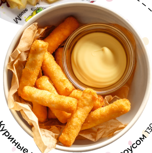
Куриные наггетсы с сырным соусом 130г 290.-