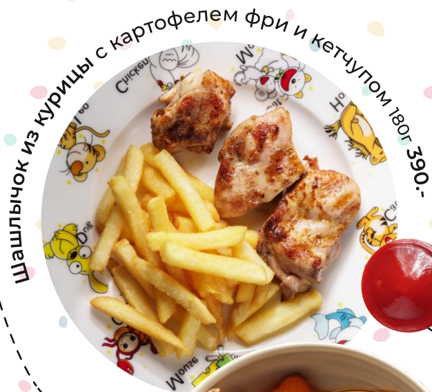
Шашлычок из курицы с картофелем фри и кетчупом 180г 390.-