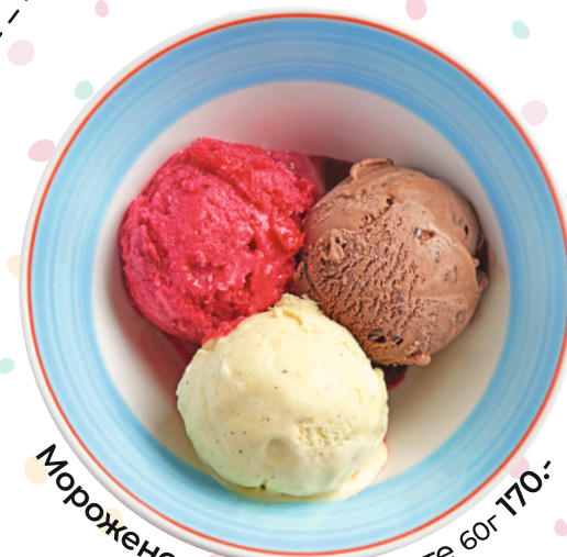
Мороженое в ассортименте 60г 170.-