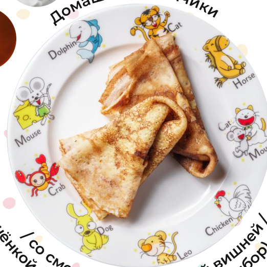
стужённой / со сметаной / с томлёной вишней / солёной карамелью (на выбор) 100/30г 140.-