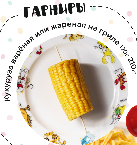
Кукуруза варёная или жареная на гриле 120г 210.-