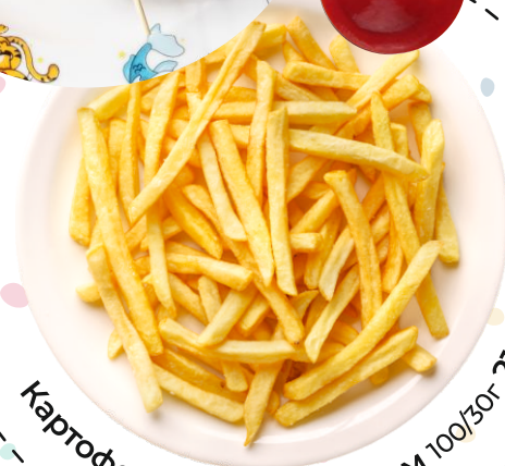
Картофель фри с кетчупом 100/30г 210.-